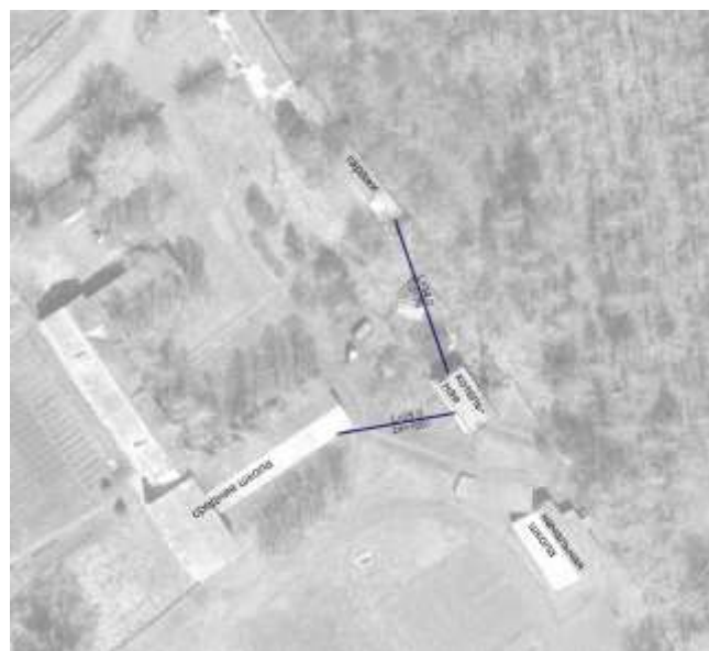
Схема 1. Тепловая сеть котельной Черняевской основной школы

Подключение к котельным новых потребителей не планируется, изменение тепловых нагрузок не предполагается.